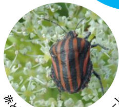
赤と黒のしましまユニフォーム (アカスジカメムシ)