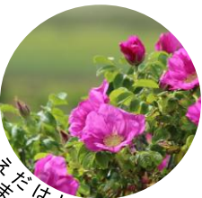
あそだはトゲトゲいにおい (ハマナス)