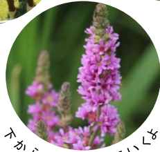
下から花がさいていくよ (エソ)