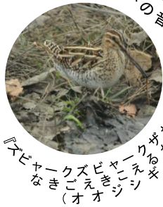
『大ジャークズビキ (オオジャークズビキ)』