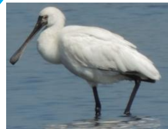
クロツラヘラサギ

北海道で見られるのはとてもめずらしく、つぎはいつみれるかわからない。このチャンスにとうふつこへ!