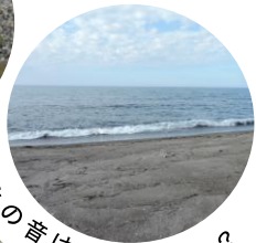
みみの音はどうきこえる?