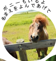
米ニーもいるよであげて (米)